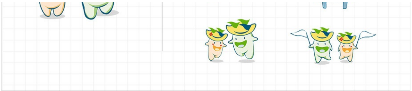
木浦 吉祥物 下