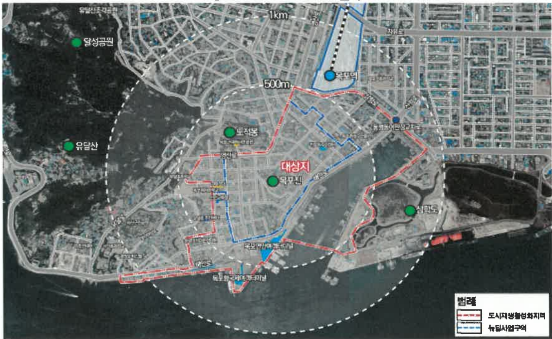
【목포시 1897개항문화거리 도시재생활성화지역 위치】