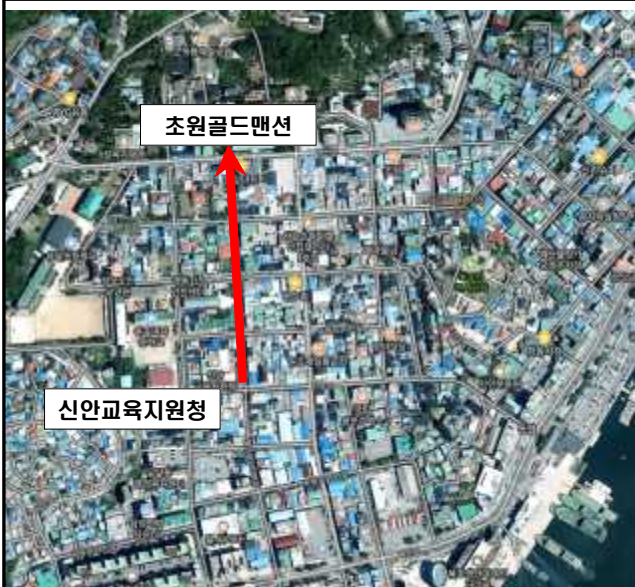
위 성 사 진