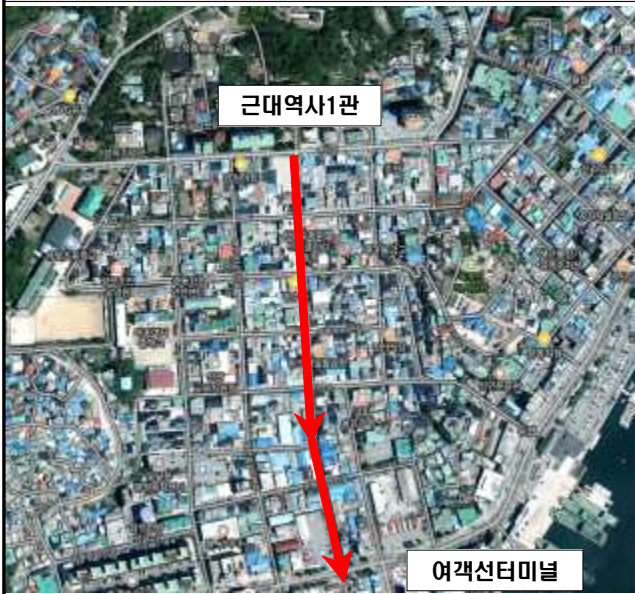
위 성 사 진